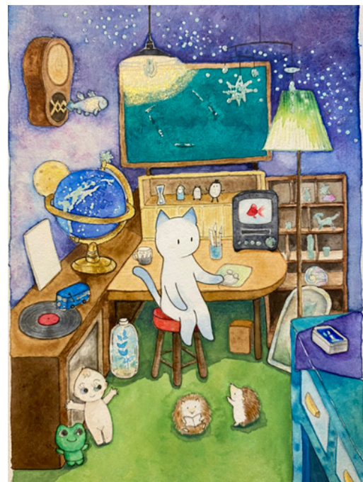
タイトル 『秘密の小部屋とネコ』 素材 透明水彩.水彩紙.水彩色鉛筆.ペン サイズ 227×158mm 制作年 2022年