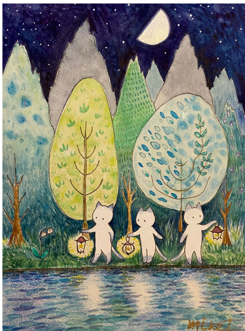
タイトル 『ネコと灯り』 素材 透明水彩.水彩紙.水彩色鉛筆.ペン サイズ 227×158mm 制作年 2022年