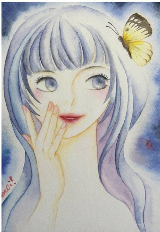
タイトル: アナタニトマル A5サイズ 2025年春 水彩用紙・水彩絵の具