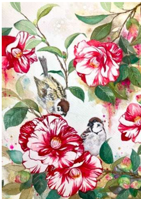
タイトル 「紅白椿 -煌めき-」 素材 透明水彩、水彩紙 サイズ W242xH332 mm 制作年 2025年

* 2026年4月28日-5月4日 Gallely Cafe Jalona Akasaka「Jalona 賞受賞者による3人展」出展予定