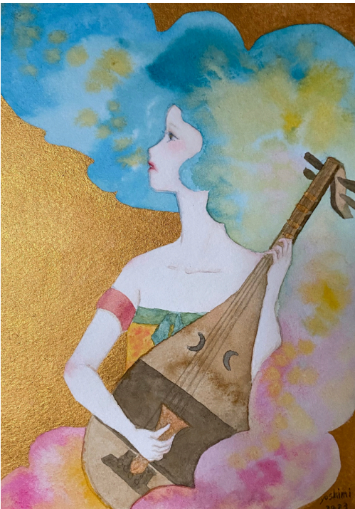
タイトル 『イチキシマヒメ』 素材 透明水彩、水彩紙 サイズ W158×H227(cm) 制作年 2023

Instagram https://www.instagram.com/yoshimi_handa/ shop https://hspyoshimi.stores.jp