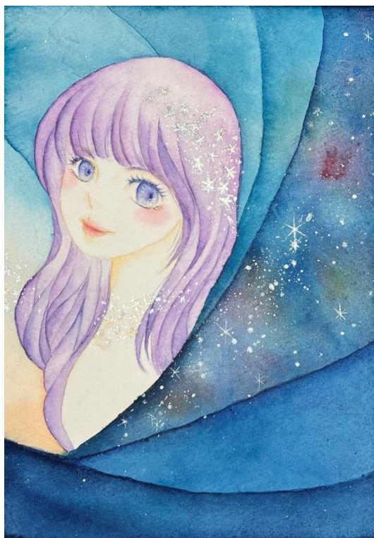
タイトル: 夜を纏う A5サイズ 2025年秋 水彩用紙・水彩絵の具